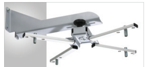
Kindermann Pro W